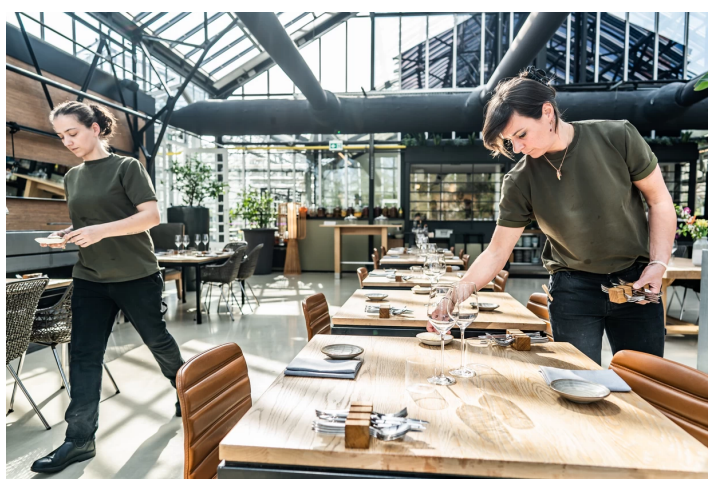
Restaurant De Kas in Amsterdam-Oost.

Het plannen van een etentje bij restaurant De Kas in Park Frankendaal is niet eenvoudig: wie verzekerd wil zijn van een tafeltje moet maanden van tevoren reserveren. Sinds kort is er een sluiproute: de website Appointment Trader verhandelt reserveringen.